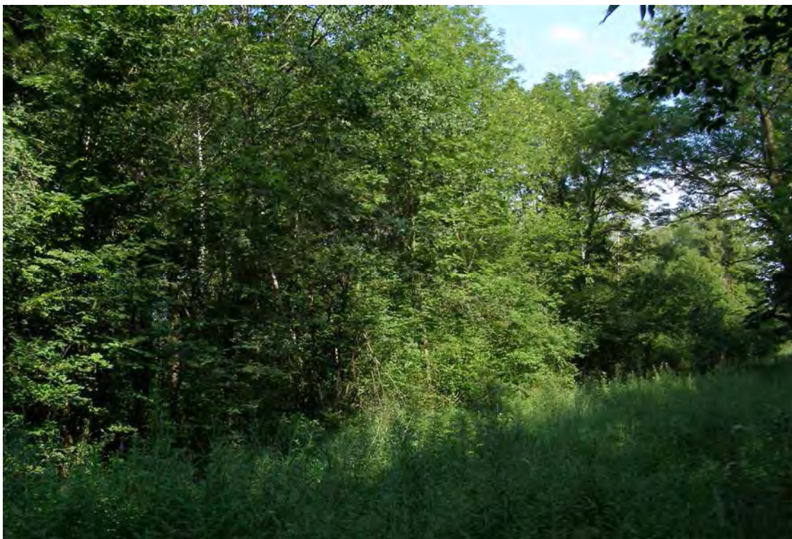
Abbildung 11: Die flussbegleitenden Wälder der Frutz nahe der Gemeindegrenze zu Koblach.

Auch wenn die Frutzaunen durch menschliche Eingriffe stark verändert wurden, sind sie aus ökologischer und naturschutzfachlicher Sicht nach wie vor sehr bedeutsam und schützenswert, so etwa als Lebensraum für eine reiche Flora und Fauna, aber auch in Hinsicht auf den Landschaftshaushalt (Lokalklima, Vernetzung, Wanderkorridor, etc.). Daneben sind die Frutzaunen auch ein beliebtes Naherholungsgebiet.