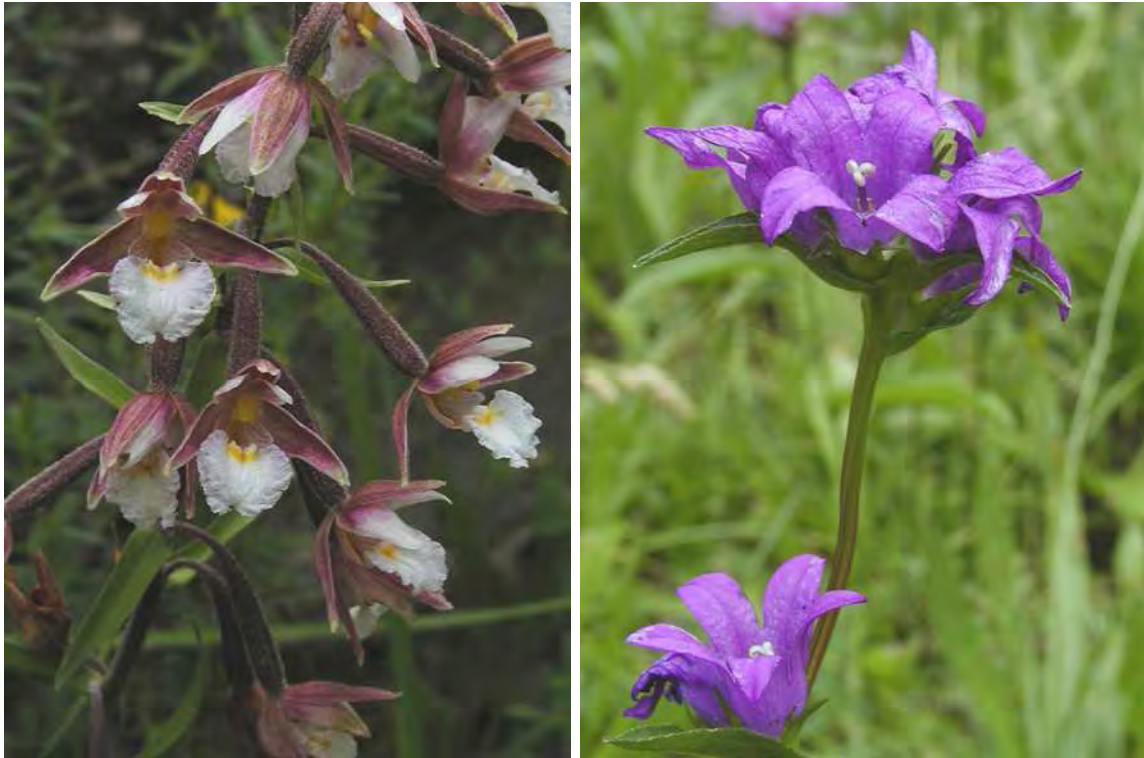
Abbildung 8: Die beiden gefährdeten Arten Sumpf-Stendelwurz ( Epipactis palustris ) links, und Knäuel-Glockenblume ( Campanula glomerata ).