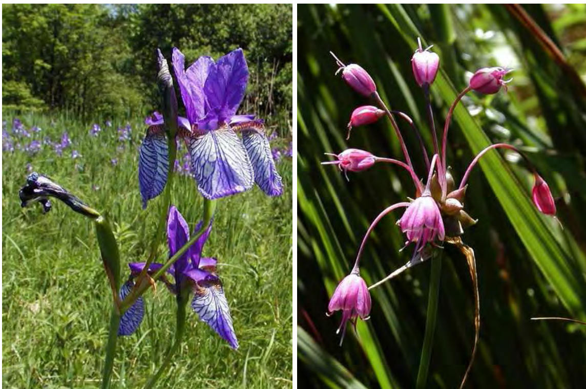
Abbildung 7: Die stark gefährdete Sibirische Schwertlilie ( Iris sibirica ) links und der gefährdete Kiel-Lauch ( Allium carinatum ), rechts.

Die beiden schmalen, durch eine Straße getrennte und mit Alleebäumen (u.a. Quercus robur , Fraxinus excelsior ) bepflanzten Restflächen sind dagegen weitgehend degeneriert und entsprechen im wesentlichen stark von Störungszeigern durchsetzten Mädesüßfluren mit Fragmenten von Pfeifengraswiesen.