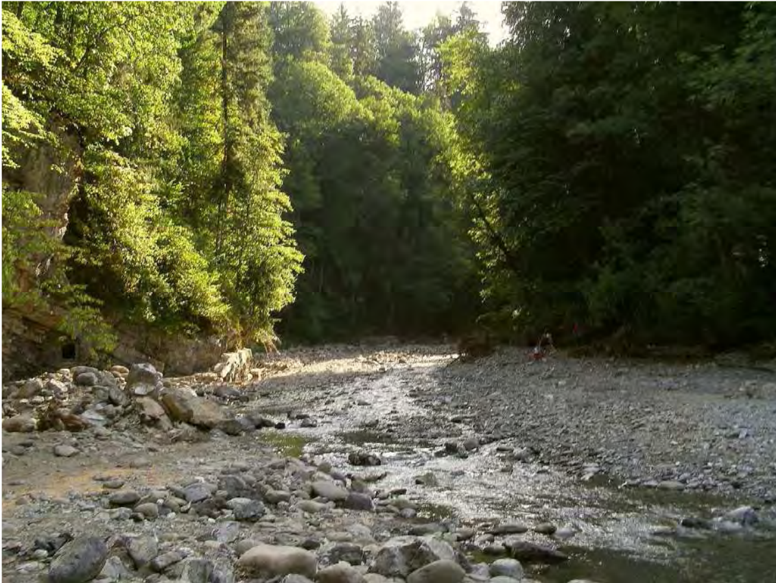
Abbildung 4: Die Frutz mit begleitenden Buchen-Tannen-Fichtenwäldern.