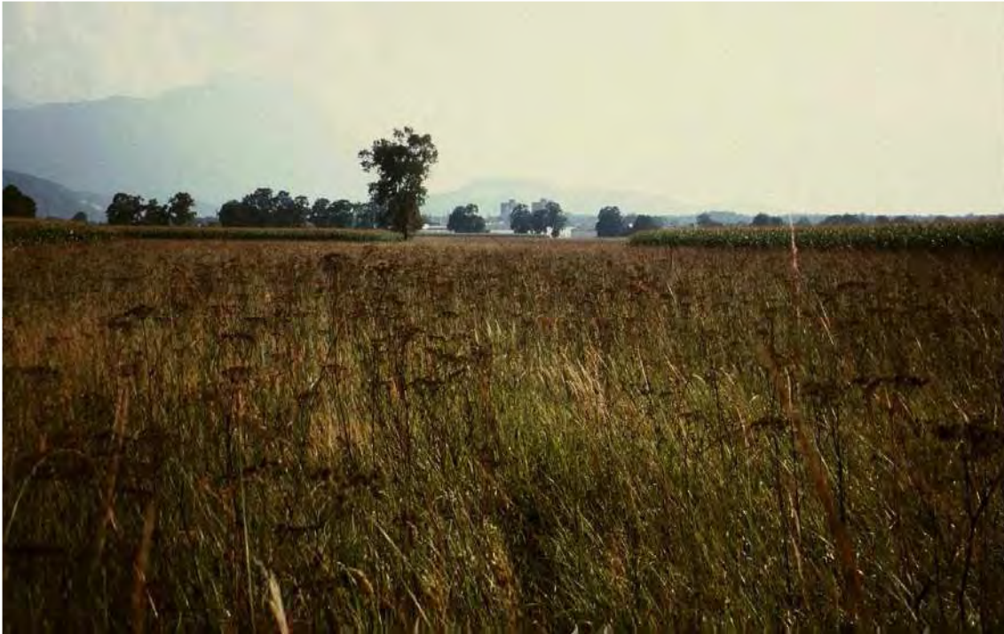
Abbildung 2: Blick auf die größte geschlossene Streuwiesenfläche des Brederiser Großfelds. Die ausgesprochen artenreichen Pfeifengraswiesen beherbergen unter anderem Massenbestände der stark gefährdeten Hirschwurz ( Peucedanum cervaria ) deren Fruchtstände am Bild sichtbar sind.