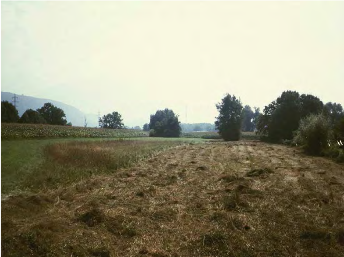
Abbildung 12: Der letzte Streuwiesenrest entlang des Mühlebachs beherbergt unter anderem die vom Aussterben bedrohte Sumpf-Siegwurz ( Gladiolus palustris ).