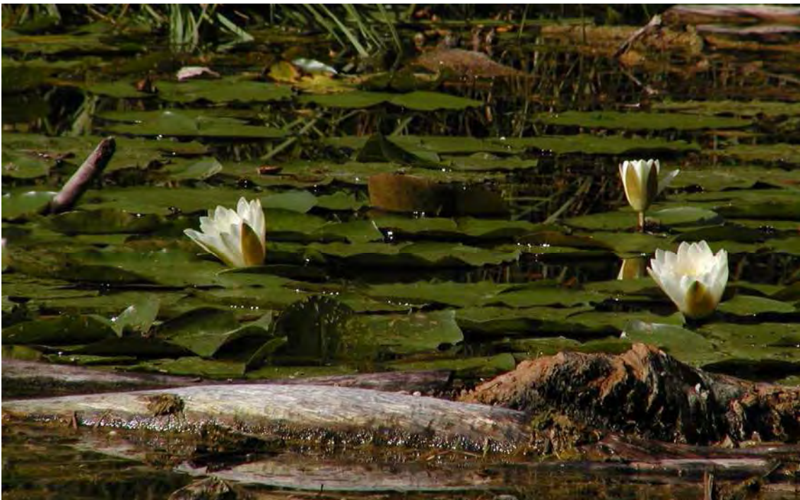
Abbildung 6: Die Weiße Seerose ( Nymphaea alba ).

Die Ufer sind aufgrund der ungünstigen Abbaulinie weitgehend als mehr oder weniger steile Kiesufer ausgebildet, spezielle Gesellschaften der Gewässer sind unter anderem deswegen nur fragmentarisch ausgebildet. Es finden sich vereinzelt Schilf ( Phragmites australis ), Teichbinse ( Schoenoplectus lacustris ) oder Seerose ( Nymphaea alba ). Auf länger ungestörten Kiesflächen wachsen bisweilen Purpurweidengebüsche ( Salicetum purpureae ) auf. Speziell an Südufer finden sich "auwaldartige" Gehölzbestockungen, die hier (abgesehen vom Güterweg) teils nahtlos in die Wälder der Roten Au übergehen.