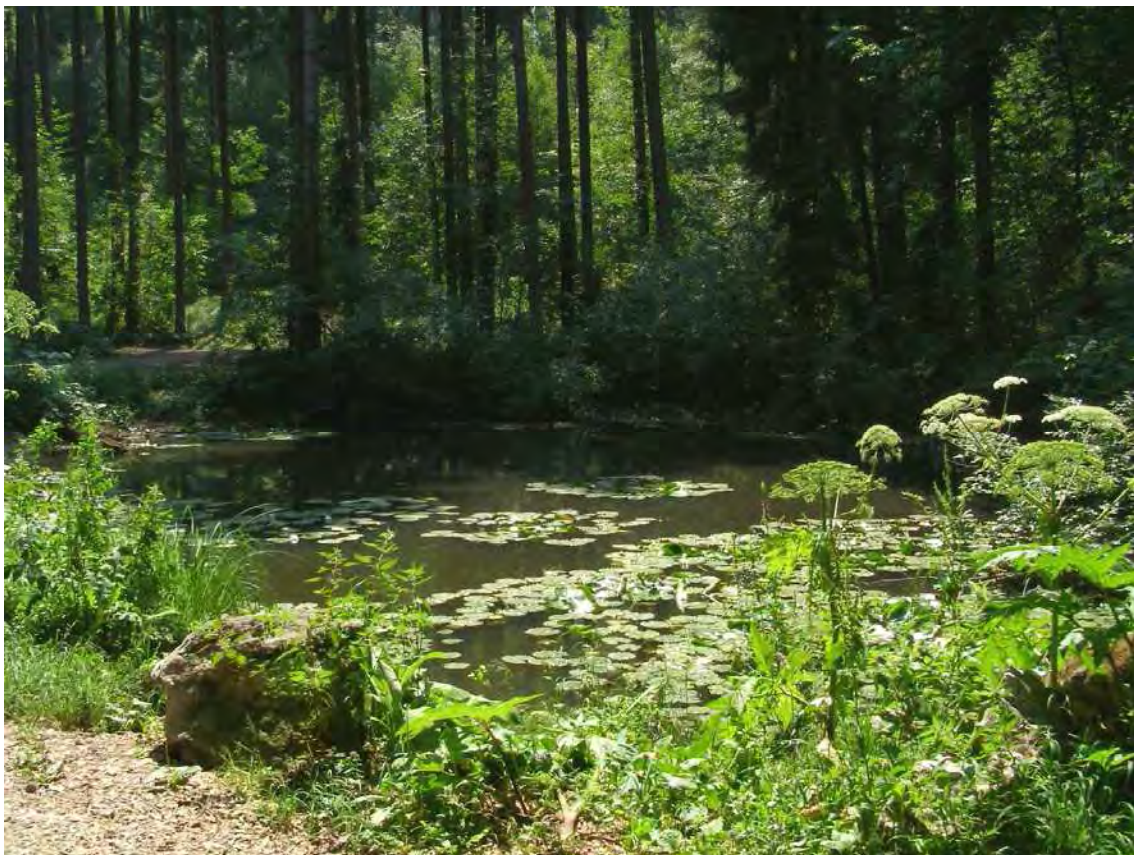
Abbildung 9: Blick auf den Egelsee, einen kleinen Waldweiher.

Der ca. 30 x 15 Meter große Weiher zeigt gegenwärtig einen nur sehr geringen Pflanzenbewuchs, was auf eine erst kürzlich durchgeführte Gewässersäuberung und die relativ starke Beschattung der Wasseroberfläche durch den umliegenden Wald zurückzuführen ist. Das Wasser war zum Zeitpunkt der Begehung sehr trüb, am Gewässergrund fanden sich größere Ansammlungen von Astwerk und Fallholz. Auffallend ist eine wahrscheinlich künstlich eingebrachte Seerose (Nymphaea sp.), die sich seit der Erstaufnahme stark ausgebreitet hat und im Jahr 2006 rund 1/8 der Gewässeroberfläche bedeckte. Am Ostufer findet sich ein ca. 2 Meter breiter Ufersaum mit Hochstauden, am Südufer wachsen einige Horste der Sumpf-Segge (Carex acutiformis) und ein Einzelexemplar des Breitblättrigen Rohrkolbens (Typha latifolia).