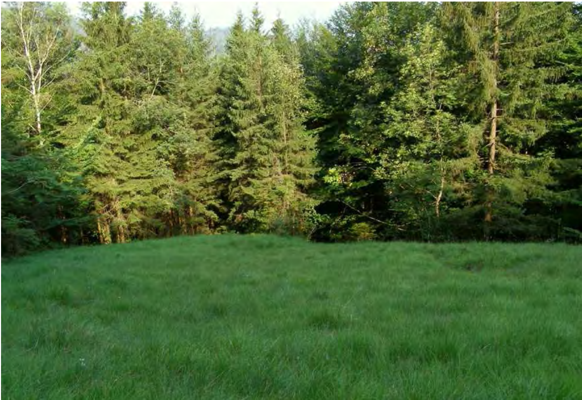
Abbildung 10: Pfeifengras-dominiertes Hangflachmoor im Gebiet von Lorex.

Im Gebiet von Lorex, auf halbem Weg zwischen Göfis Tufers und Übersaxen sind auf einer Hangverflachung zwei kleine Flachmoore zu finden. Das obere Flachmoor liegt am Rand der Fettwiesen der Rodungsinsel von Lorex. Die Vegetation nimmt eine Zwischenstellung zwischen dem Davallseggenried ( Caricetum davallianae ) und den präalpinen Pfeifengraswiesen ( Gentiano asclepiadeae-Molinietum ) ein. Die zweite Moorfläche liegt in einer kleinen Lichtung im Buchen-Tannenwald unterhalb von Lorex. Es handelt sich dabei um ein höchst bemerkenswertes Quellflachmoor mit ausgeprägter Kalktuffbildung. Die Vegetation entspricht der in Vorarlberg vom Aussterben bedrohten Gesellschaft des Schwarzen Kopfrieds ( Schoenetum nigricantis ).