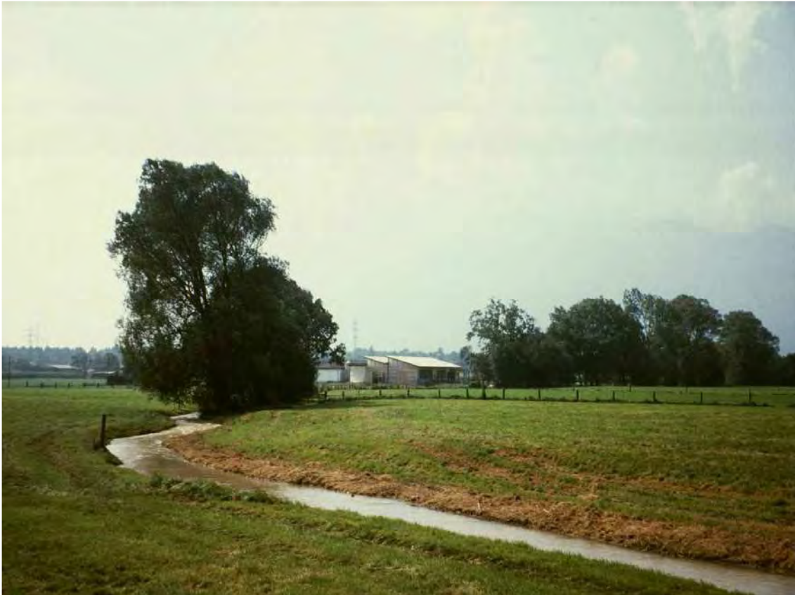
Abbildung 5: Im östlichen Teil des Mühlbachs reichen die landwirtschaftlichen Intensivflächen teilweise bis direkt an den Gewässerrand.