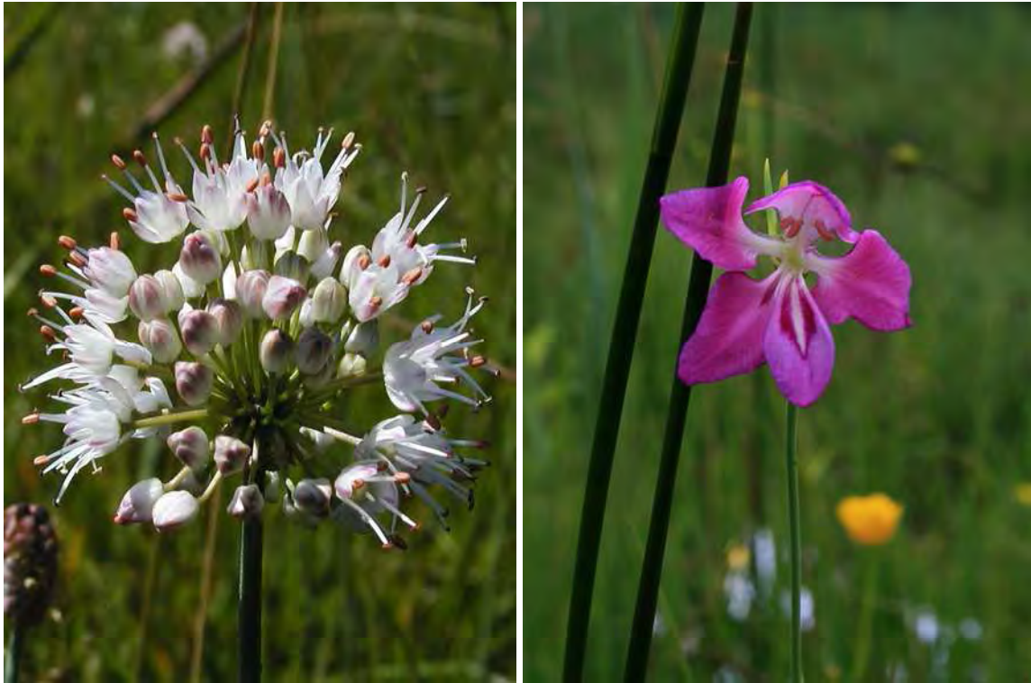
Abbildung 3: Die beiden vom Aussterben bedrohten Arten, Duftlauch ( Allium suaveolens ) links, und Sumpf-Siegwurz ( Gladiolus palustris ), rechts.