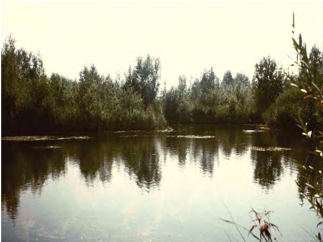
Abbildung 13: Das Paspels-Biotop wurde erst in den letzten Jahren angelegt und entwickelt sich zu einem wertvollen Laichgewässer für die Amphibienfauna.

Das Paspels-Biotop (vormals „Nägele-Biotop“) umfasst mehrere Stillgewässer, die teils als tiefere Teiche, teils als reine Flachwasserteiche angelegt wurden und somit den Laichgewässer-Ansprüchen verschiedenster Amphibienarten entsprechen. Die Teiche werden von mehr oder weniger ausgedehnten, im Wesentlichen von Schilf ( Phragmites australis ), Rohrkolben ( Typha latifolia ) und Teichbinse ( Schoenoplectus lacustris ) aufgebauten Röhrichten gesäumt. Daneben finden sich beispielsweise Schwimmblattbestände mit Laichkraut ( Potamogeton natans ) und submerse Bestände des Ährigen Tausendblatts ( Myriophyllum spicatum ). Eingebettet sind die Teiche in ein stark reliefiertes Gelände mit Gebüsch und teils noch offenen Ruderalfluren. Die Vegetationsentwicklung dieser Bereiche erfolgte weitgehend spontan, nur randlich wurden Gehölze gepflanzt.