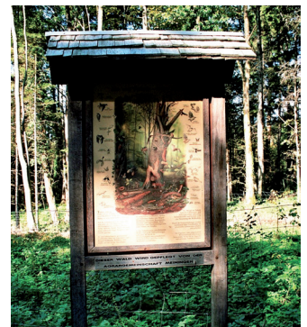
Im Oberauwald informieren zwei Lehrtafeln über den Stoffkreislauf im Wald und die Bedeutung des Totholzes.