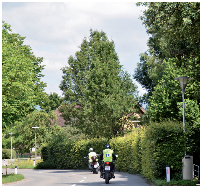
Die Straßenbeleuchtung in Meiningen wird optimiert.

Im Zuge der Ortsplanerstellung wird auch ein Optimierungsbericht verfasst. In diesem Bericht werden die Optimierungspotenziale hinsichtlich Beleuchtungsqualität, Energieeffizienz und Kostensenkung analysiert. Die Gemeinde Meiningen hat dann fundierte und realistische Zahlen, um Maßnahmen für eine mögliche Kosteneinsparung zu prüfen. Zudem wird ein Sanierungsplan für die Modernisierung der Straßenbeleuchtung und Umstellung auf LED-Leuchten erstellt. Aufschlussreich wird dann der Jahreskostenvergleich der Strom- und Wartungskosten vor und nach einer eventuellen Umstellung auf LED-Leuchten sein. Dieser Kostenvergleich ist dann die Grund-