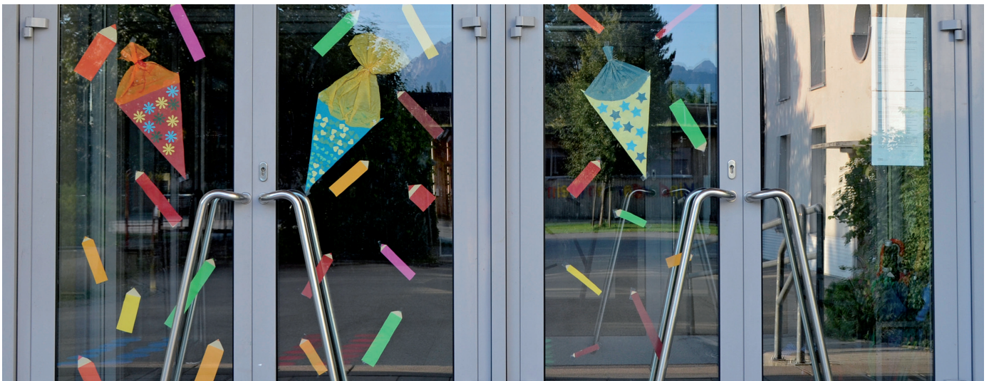
Ausgaben für Bildung und Betreuung von Kindern und Jugendlichen ist ein ständig wachsender Faktor im Gemeindebudget.