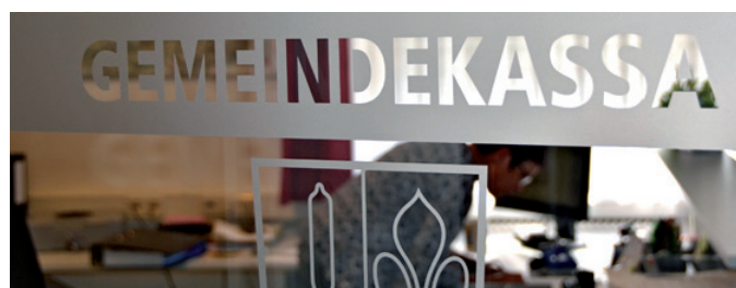
Die Gemeindekasse wird künftig zu einem guten Teil von der Finanzverwaltung Vorderland mitbetreut.

Die Verwaltungsgemeinschaft wurde im Herbst 2011 im Regio-Zentrum Sulz eingerichtet und übernimmt weite Teile der finanziellen Agenden der beteiligten Gemeinden. Neben den üblichen Buchhaltungsarbeiten steht vor allem das strategische Finanzmanagement im Fokus. Zu den Hauptaufgaben gehören unter anderem die Erstellung von mittelfristigen Finanzplanungen, das Darlehensma-