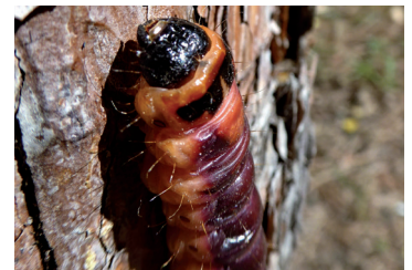
Scharlachroter Plattkäfer und dessen Raupe

Ein holzbewohnender Käfer wird meist mit „Schädling“ assoziiert. Bietet der Wald jedoch viel Unterwuchs und genügend Totholz, so nimmt die Vielfalt der Käferarten zu. Gleichzeitig vermindert sich aber auch das Risiko von Massenvermehrungen forstlich relevanter Käfer. Seit Längerem hat auch in Meiningen, was die Waldbewirtschaftung betrifft, ein Umdenken hin zu natürlicher und gezielter Verjüngung und Belassen von Totholz eingesetzt. Durchforstung im ohnehin standortfremden Fichten-Stangenholz sowie langfristige Umwandlung in einen Laubmischwald sind zwei wesentliche Maßnahmen der Agrargemeinschaft Meiningen. So lässt es sich dem auf die Fichte spezialisierten Borkenkäfer zu Leibe rücken.