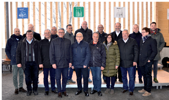
Oben und Mitte: Eröffnung Altstoffsammelzentrum (ASZ) Feldkirch und Vorderland.