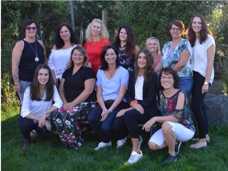
Das Kinderteam Meiningen

Wir freuen uns auf eine gute Zusammenarbeit und wünschen Euch und Eurem Kind ein wunderschönes, ereignisreiches Kindergartenjahr!